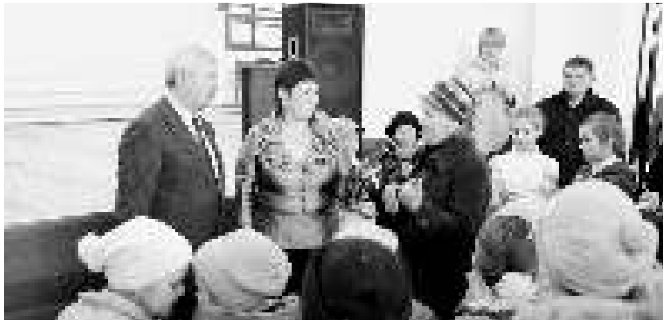
Жители поселка Петровского Озерного сельского поселения Красноармейского муниципального района внесли свои предложения в народный бюджет.

На встрече с председателем Законодательного Собрания Челябинской области Владимиром Мякушем (фракция «Единая Россия») прозвучали наиболее актуальные для поселка просьбы и предложения.