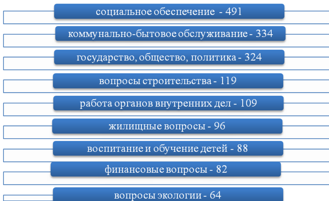
Рисунок 4. Тематическое распределение вопросов

В своих обращениях в 2018 году граждане обозначили 2574 вопроса. Наиболее значимыми для жителей Челябинской области как и в прошлом году были вопросы социального обеспечения (рис.4).