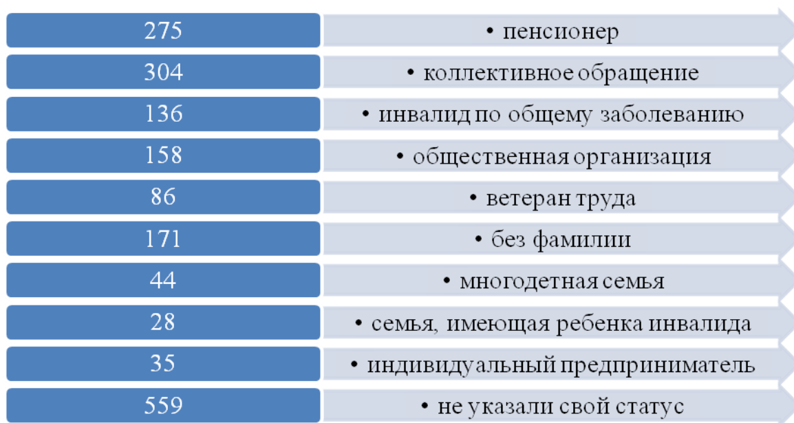
Рисунок 3. Основные категории обратившихся граждан

Наибольшее количество обращений поступило от пенсионеров, представителей общественных организаций, инвалидов по общему заболеванию, ветеранов труда, многодетных семей и семей, имеющих детей-инвалидов (рис. 3).