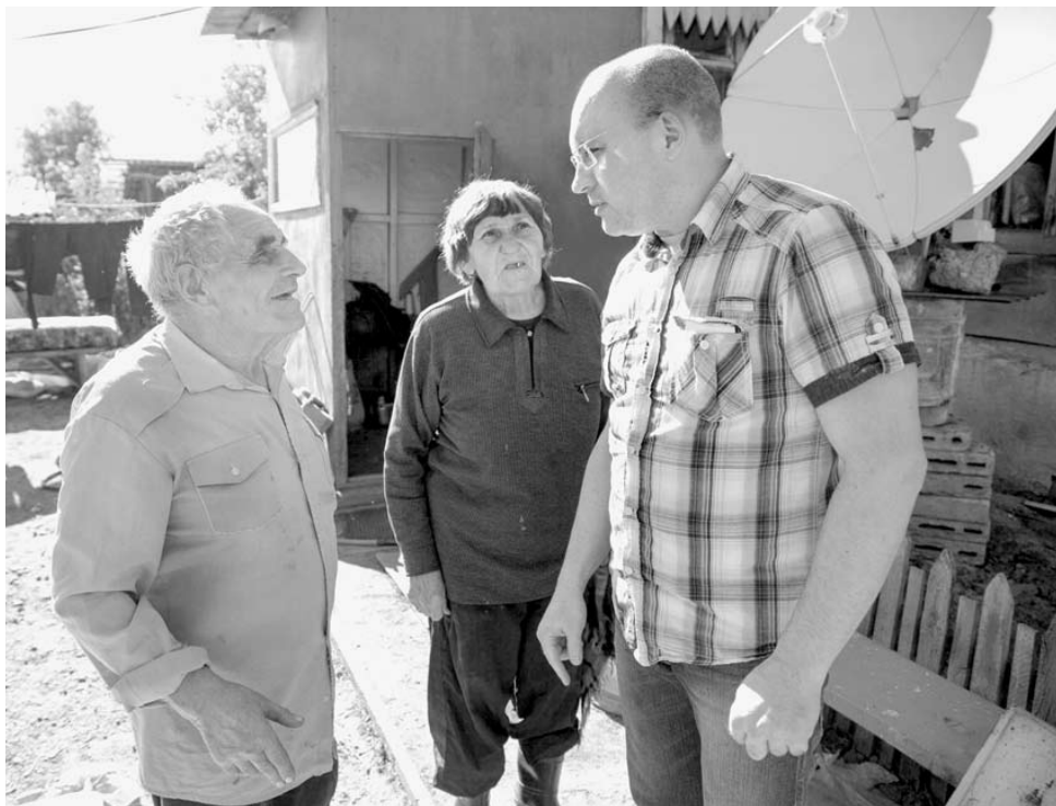
Ветераны войны, имущество которых пострадало от наводнения, благодарят депутатов ЗСО за оказанную помощь.

Обращаемся к строительным предприятиям, фермерским и сельскохозяйственным организациям Челябинской области с просьбой оказать посильную помощь пострадавшим от наводнения. На сегодняшний день людям необходимы стройматериалы для восстановления своих домов, продукты питания, овощи. Желающие помочь могут обратиться в Законодательное Собрание Челябинской области (улица Кирова, 114), кабинет 218.