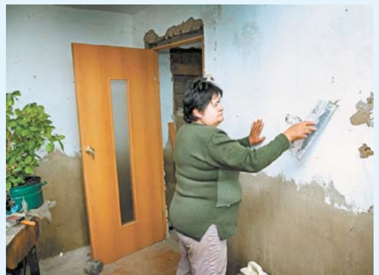
Жители пострадавших районов восстанавливают свои дома после наводнения

Спасибо за сострадание, добросердечность и помощь, которую вы нам оказали в трудные дни нашей жизни.