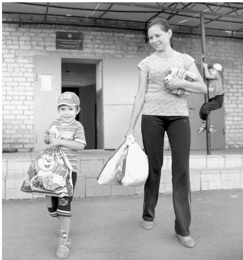
Каждый житель Кулевчей от мала до велика получит продуктовый набор.