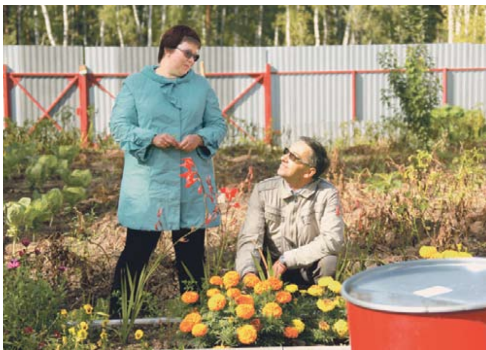
Приусадебный участок украшает изысканный цветник.