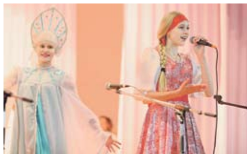
На церемонии открытия.

Кстати, это не первый ДК в Увельском районе, который был отремонтирован благодаря поддержке областного парламента. В декабре 2013 года свои двери после капитального ремонта открыл ДК в селе Хомутино, в декабре 2014 года заработал обновленный Дом культуры в поселке Синий Бор.