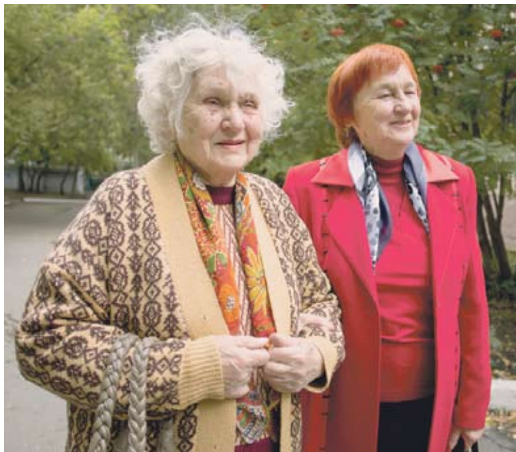
В санатории-профилактории «Металлург» сделано все, чтобы ветераны отдыхали с хорошим настроением.

Стоит отметить, что с 2007 года путевки ветеранам предоставлялись в рамках приказа министерства социальных отношений Челябинской области «Об утверждении порядка обеспечения отдельных категорий граждан путевками на санаторно-курортное оздоровление». С этого года бесплатные путевки выделяются в