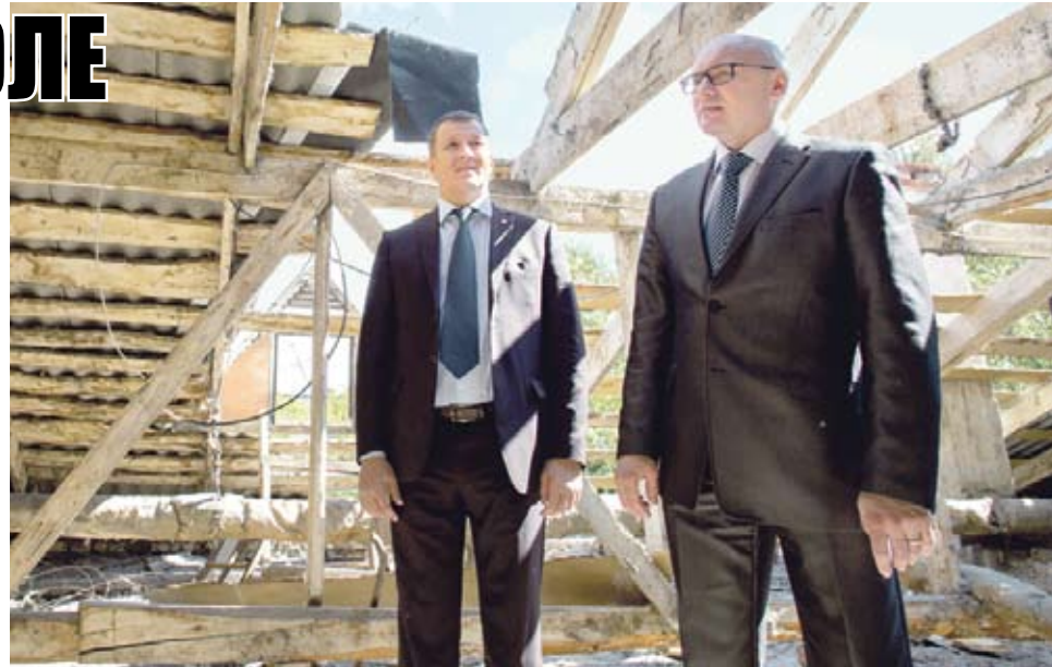
Ради проверки хода капитального ремонта представителям «Народного контроля» порой приходится спускаться в подвал и подниматься на чердак.