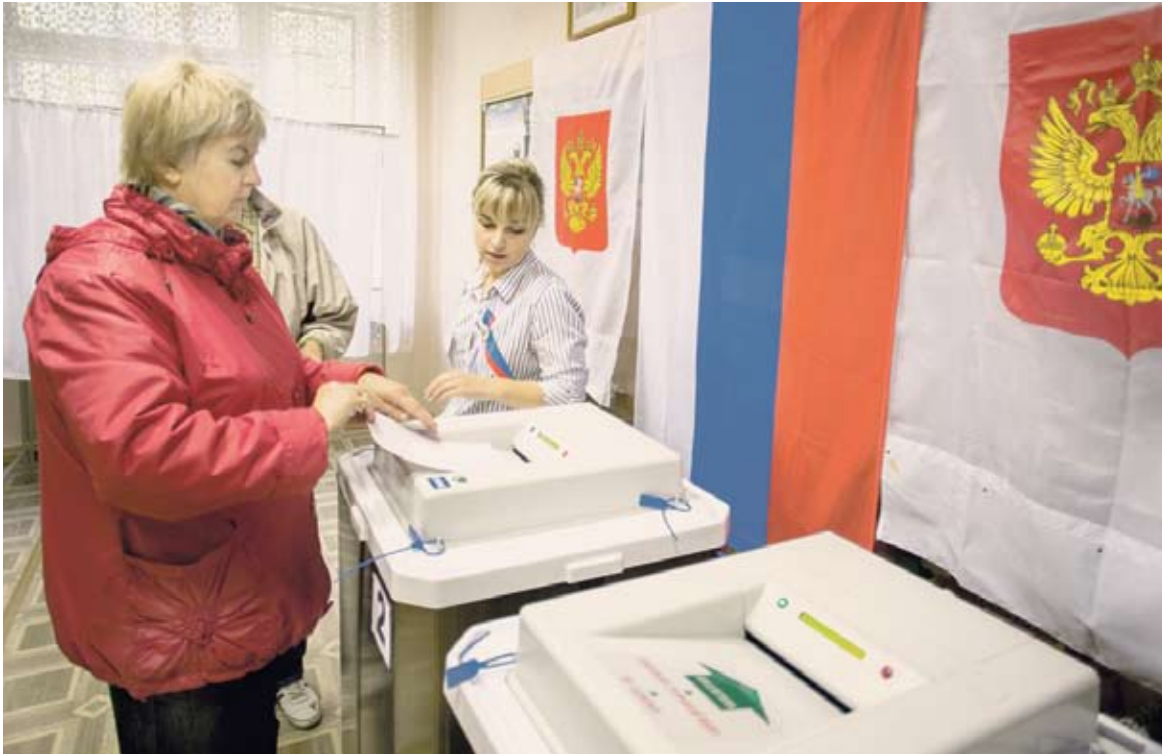
Явка на выборах в Челябинской области была одной из самых высоких в стране.

13 сентября южноуральцы выбрали новый состав законодательной власти на ближайшие пять лет. В общей сложности явка на избирательные участки Челябинской области составила 41,32 процента.