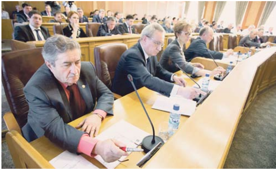
Депутаты Законодательного Собрания Челябинской области V созыва на одном из последних заседаний парламента.

Всего за пятый созыв депутаты подготовили, обсудили на заседаниях рабочих групп, комитетов и приняли на заседании областного парламента 967 законов Челябинской области, касающихся разных сфер жизнедеятельности нашего региона. С начала созыва (октябрь 2010 г.) состоялось 58 заседаний областного парламента.