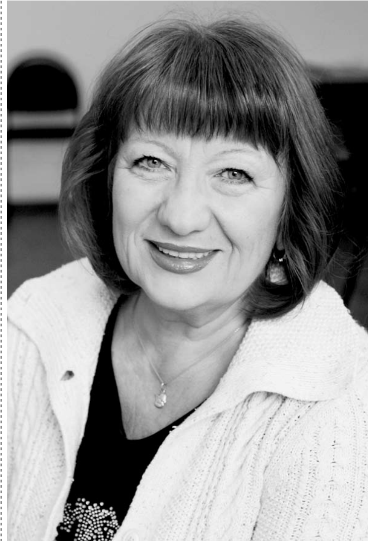
ЛАУРЕАТЫ ПРЕМИИ ЗСО

В общем, жизнь продолжается. Пусть не такая бурная и сумасшедшая, без жесткой, почти военной дисциплины, вне конкуренции. Это другая жизнь, но тоже полная творчества, без суеты, позволяющая рассмотреть все свои оттенки.