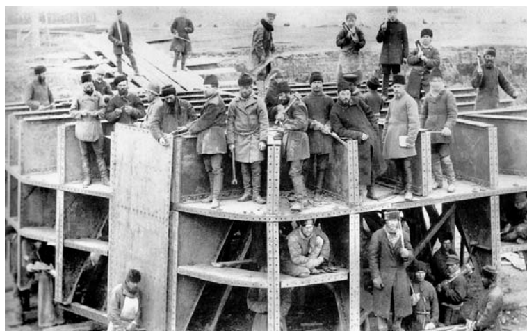
▲ Кессонные (пневматические) работы. Ж/д мост.

Зарплата южноуральского металлурга или шахтера составляла 20 — 60 копеек в день, это было в два-три раза меньше, чем в южных регионах страны. На такие деньги заводчане могли позволить себе ежедневно