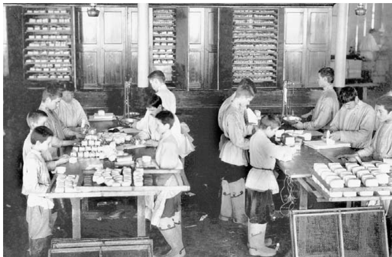
▲ Чаеразвесочная фабрика Высоцкого. Челябинск.

трудиться, например обязательные сверхурочные работы. Основной труд был настолько мало оплачиваемым, что рабочий из-за лишней копейки был согласен на подработки. Уставшие люди в результате производственных травм нередко становились инвалидами или даже расставались с жизнью. Вот какие воспоминания о заводском прошлом остались у одного из забойщиков: «Трудно было. Выработки были тесные. Приходилось на коленках работать. Высота не превышала 70 см. Все время в поту. Возили руду тачками. Кроме кайла и лопаты ничего не было. Крепкие породы, что кайлу не поддавались, вручную бурили. Буришь, а вся пыль на тебя... Выработки не проветривались. Забой сальной свечой освещался. Придешь в забой, все с себя снимаешь, спецовки не было... Жара страшная была, до 50 градусов доходила... Кипяченой воды не было. Какая вода в шахте есть, ту и пили. Были забои, что вода сверху льет, как дождь проливной».