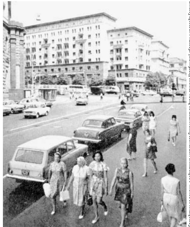
Образцом при создании проспекта Ленина в Челябинске послужила улица Горького (ныне Тверская) в Москве.

К сожалению, узнать, как должна была выглядеть Южноуральская ВДНХ, нам не удалось, однако известно, что по генплану 1947 года она должна была расположиться на территории ближнего Заречья, возле кинотеатра «Родина», а по генплану 67-го года – в деревне Шершни. Там же, кстати, должен был появиться Академгородок.