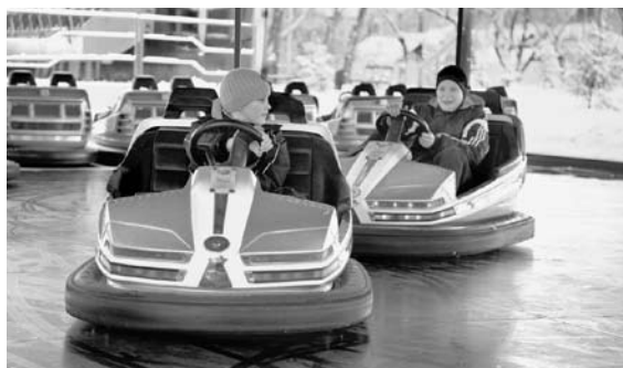
Особый восторг от благоустройства п. Роза испытывают дети — в поселке заработал парк аттракционов