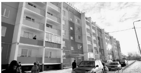
Коркино. Дом, который специально построен для переселенцев из поселка Роза