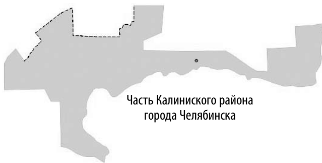
Часть Калининского района города Челябинска

Депутат Законодательного Собрания Челябинской области Игорь Свеженцев (фракция «Единая Россия») в областном парламенте представляет интересы жителей Калининского района. В общей сложности на территории избирательного округа проживает более 90 тысяч избирателей.